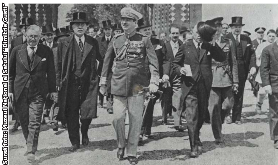
Dimitrie Gusti, în stânga, la deschiderea Muzeului Satului, în 1936, alături de Regele Carol al II-lea (al treilea de la stânga la dreapta)

Dimitrie Gusti a fost președintele comitetului de Direcție și al Consiliului de Administrație constituit pentru întocmirea Enciclopediei României, operă monumentală, de talie europeană. "Elaborarea acestei Enciclopedii sub semnul unei încordări colective" - menționa Dimitrie Gusti în prefața primului volum - "a reprezentat marea datorie a unei generații cu profundă conștiință de propria-i forță și propria-i misiune" .